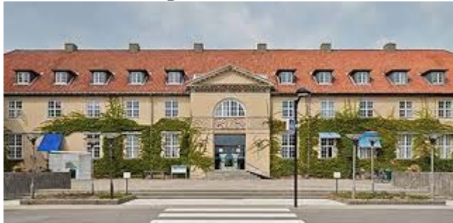
Gentofte Hospital, Medicinsk afdeling C